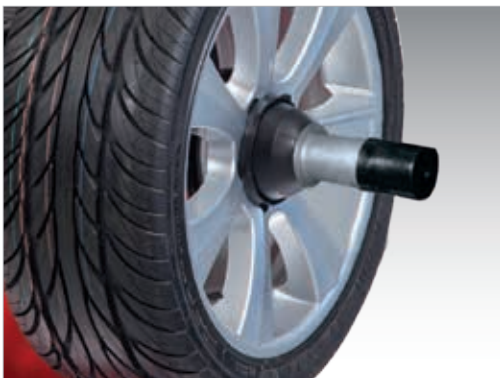
Dispositivo De Fijación Power Clamp