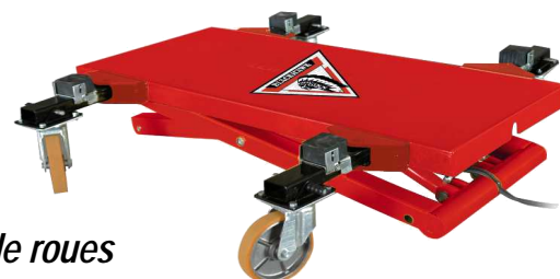
STL2910 without set of wheels - sans kit de roues