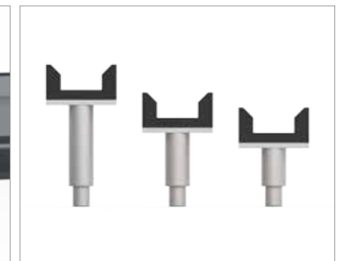
MERCEDES/IVECO ADAPTORS ADATTATORI MERCEDES/IVECO