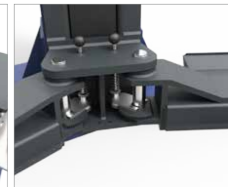
ARMS LOCK BLOCCA BRACCI