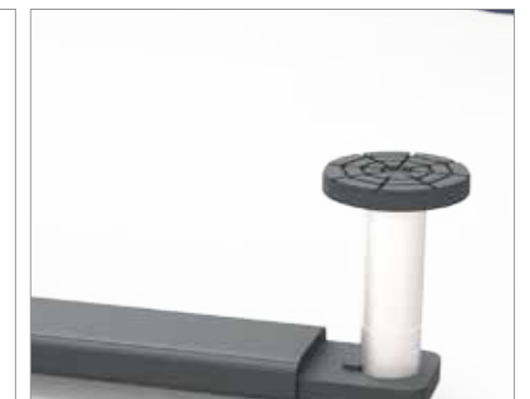
RUBBER PAD TAPPONE IN GONNE