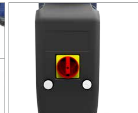
ELECTRICAL CONTROL BOX QUADRO ELETTRICO