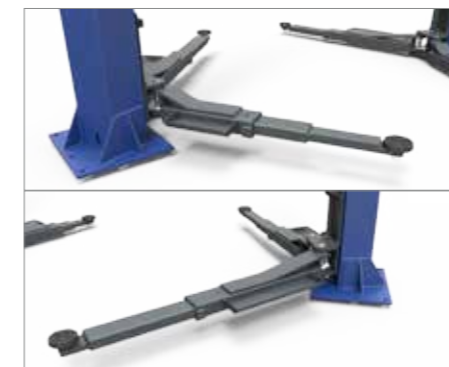
ARMS EXTENSION ESTENSIONE BRACCI