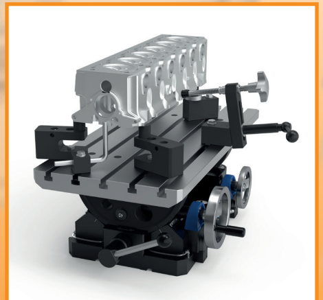
TAVOLA LIVELLANTE A DUE ASSI DUAL AXIS LEVELING TABLE